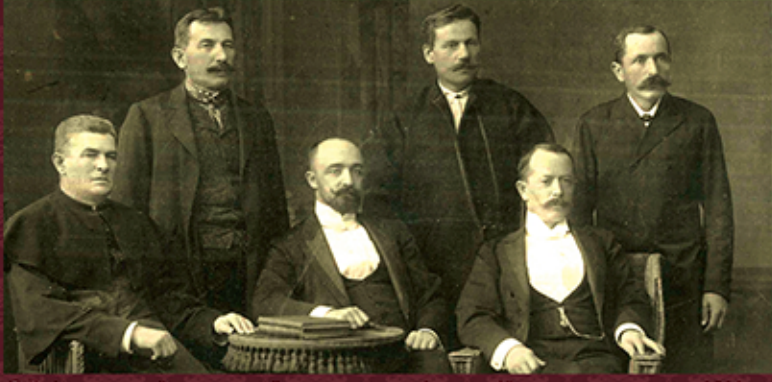
С.Дністрянський серед українських депутатів австрійського парламенту. 1911 р.