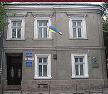
Будинку Тернополі, в якому народився Станіслав Дністрянський