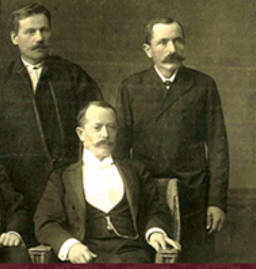
С.Дністрянський серед українських депутатів австрійського парламенту. 1911 р.