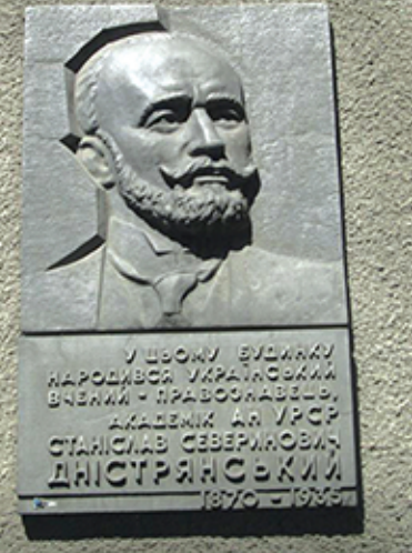
Меморіальна дошка на будинку Дністрянських у Тернополі